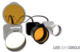
Lup Lys (2)